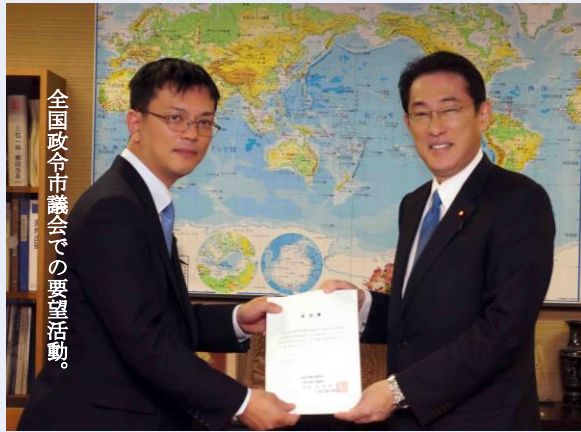
全国政令市議会での要望活動。