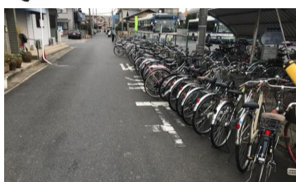
交番の写真、ついに完成。