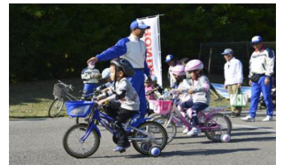
子どもに自転車の乗り方を教える場所が必要

民間連携により、高齢者・子供向け、貸出自転車の充実、シミュレーター設置など。交通安全学習を体験できる場所を充実。花見川サイクリングロードに面した休憩所を整備。