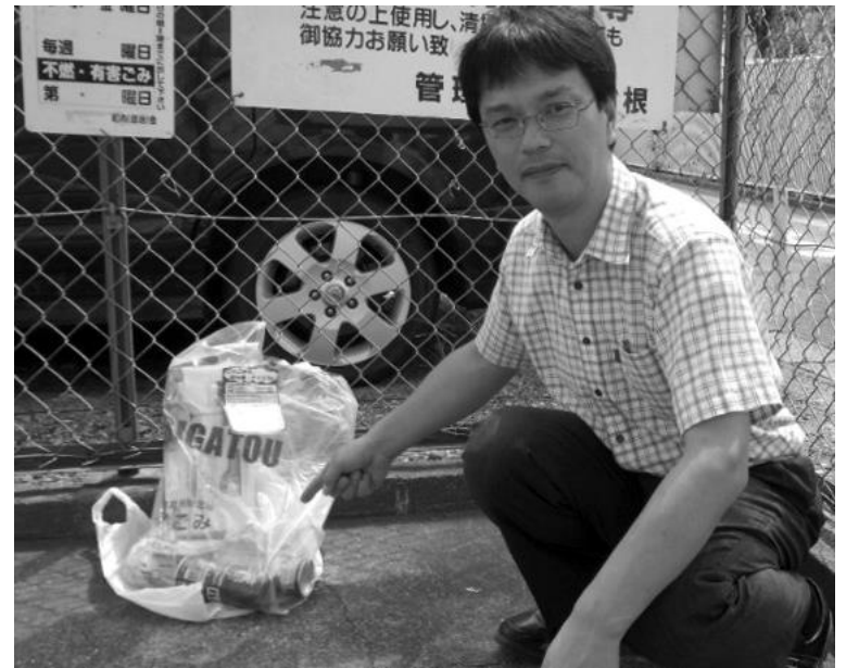
間違いが散見されるガスボンベ混入物 近所で次の収集日までに排出者が回収しなかったため、地元の方と再分別しました・・・

ゴミステーションに残留物があると新たなゴミを呼ぶ。市民ボランティアの廃棄物適正化推進委員には限界がある。清掃工場・本庁・各清掃事業所が責任の所在を明確にし、きちんと取り残しゴミの対応を定めるべき。