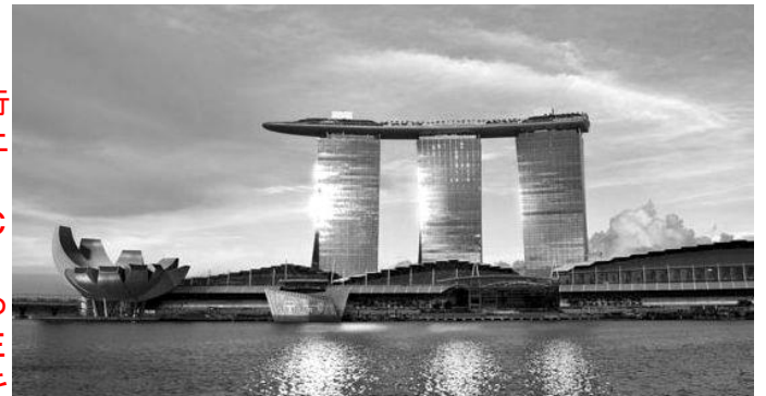
カジノ色を希薄にして成功したマリーナベイサンズ

高い経済効果が期待できるMICE（大規模会議のミーティングのM、表彰や研修旅行のインセンティブトラベルのI、会議や総会などのコンベンションのC、イベント・エキシビションのE）を誘致することは、本市経済の活性化に大きく貢献する。IRはMICEによるビジネス客のアフターコンベンションとして、MICE誘致に寄与する。所謂IR推進法案において、民間事業者が設置・運営するとされ、用地も関係者との協議、調整に関わっていく必要があるが、民間事業者が確保する。本市も「グローバルMICE強化都市」に選定されているが、市民・地元経済界のコンセンサスの形成を図り、魅力をアピールしていく必要がある。