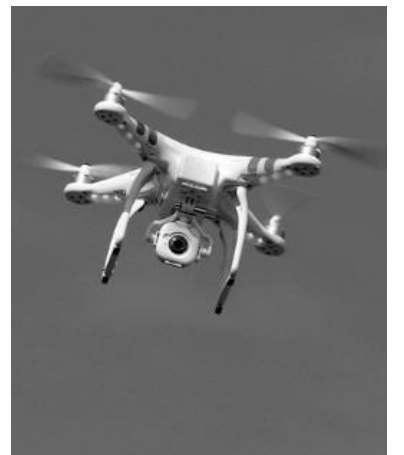
〔ドローン飛行イメージ〕

飛行性能は、航続時間約 20 分、最大航続距離約 2 キロメートル、操作方法は、手動による遠隔操作のほか、自律航行システムによる自動運航が可能で、ビデオカメラや複合ガス検知器を搭載、映像伝送や可燃性ガスなどを検知する機能を備える。自然災害を始め、爆発や崩落の危険性があり、消防隊が接近できない災害現場での情報収集活動、可燃性ガスや有毒ガスの漏洩・飛散現場では、ガス濃度の測定や成分の分析など、検知活動に効果に期待。