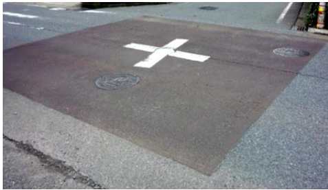
現在のあずき色約 26 万円の施工費

本市の赤はあずき色系だが、朱色系の方が目立つ。現在の全面塗装より、朱赤に白枠の方が目立つ、コストも約 4 分の 1 です。（道路幅員 4m 場合、右側の写真は埼玉県新座市。約 4 カ所分整備できます。）