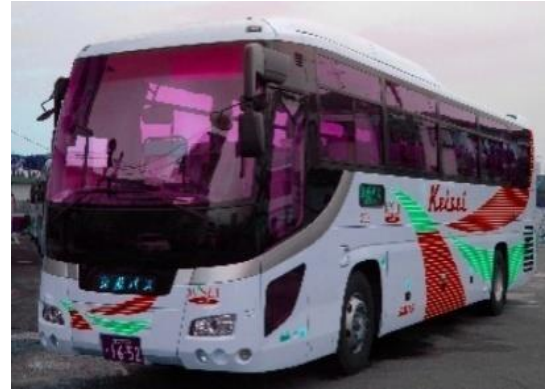
〔高速バスに使用する車両のイメージ〕

鉄道の駅から離れた地域に対し、現在京成バス(株)が「千葉北 | C 周辺地区～東京駅」間を運行している高速バスを活用し、千葉市北部地区から東京方面へのパーク&バスライドの効果を検証する社会実験を実施します。また高速バスダイヤ改正が