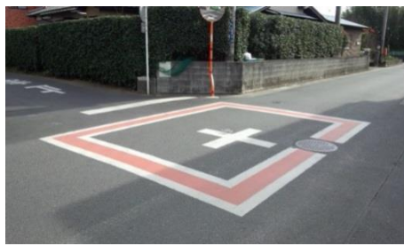
朱赤・白枠の約約 7 万円の施工費