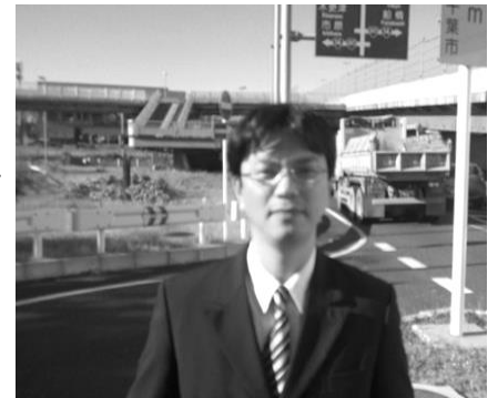
私の後方に設置予定。

新港・横戸町線では下り車線穴川十字路付近だけでなく、動物公園の質問でも触れた、登り車線、 国道 357 号線との交差点も 開通時から私を含め多くの方が指摘していた通り、 酷く渋滞 している。市役所方面には信号を経由しない、「左折可」、の車線の計画がある。渋滞緩和のためにも「左折可」 車線の早期整備が必要 。