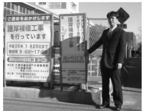
稲毛小学校協の草野水路