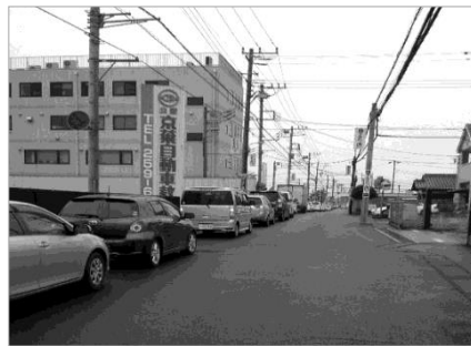
交差点の反対側の京葉自動車教習所から国道16号まで約300m渋滞しています。撮影の平日昼頃でも11分かかりました。