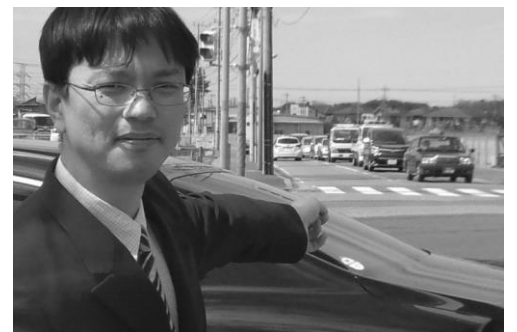
予定地交差点で、出店前でもこの状況、バス通りでもあり、大丈夫でしょうか...

渋滞問題への対策を採るべき、バス等公共交通機関への配慮、青少年育成に防犯対策が必要。近隣の旧イトーヨーカドーは渋滞しすぎて程なく敬遠され撤退した。