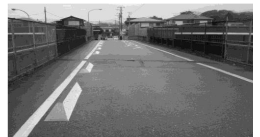
天台～萩台歩道橋上イメージランプ