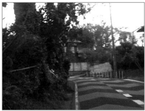
この木は、市有地に。

Point 原則は理解するが、著しく衛生上の問題があると、大多数の他避難民に体調等で影響する可能性がある。台風の時などは事前に準備し、 休眠施設や無料定額宿泊所で特別に対処 すべき。