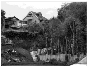
マンション建設の隣接地。これだけ急角度では隣接地も早期に整備すべき。